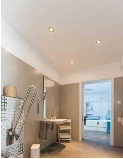
Schiebetür von Schlafzimmer 1 zum Duschbad