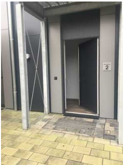
Eingangsbereich Wohnung 2