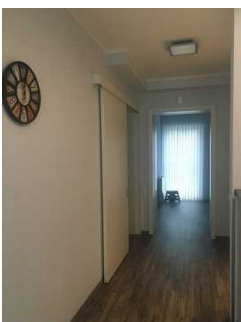
Flur zu den Schlafzimmern und WC