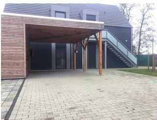
Weg vom Parkplatz zum Wohnungseingang