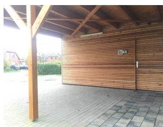
Parkplatz vor dem Haus