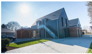
Ferienhaus Hoddersdiek - Wohnung 2