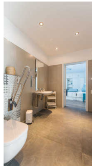
Duschbad mit Blick ins Schlafzimmer 1