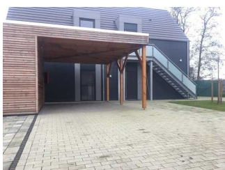
Weg vom Parkplatz zum Wohnungseingang