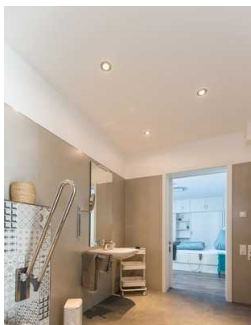
Schiebetür von Schlafzimmer 1 zum Duschbad