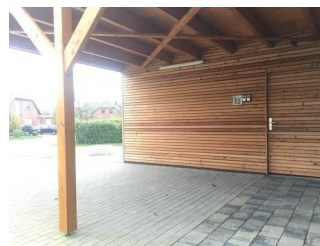
Parkplatz vor dem Haus