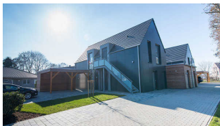
Ferienhaus Hoddersdiek - Wohnung 2